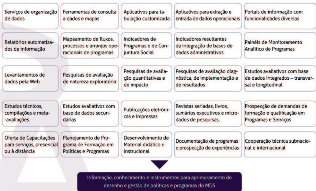
Diagrama 1 Diversidade de produtos, serviços e entregas da SAGI para atender às demandas crescentes da agenda de políticas e programas do MDS

Reconhecendo que boa parte do sucesso na implementação de um programa decorre do nível de engajamento e compreensão dos agentes operadores acerca dos objetivos, público-alvo e processos de trabalho envolvidos na produção dos serviços e ações, a SAGI também vem ampliando sua atuação na organização de cursos de capacitação e de formação, de curta e média duração, presenciais e a distância, assim como no desenvolvimento de produtos informacionais que contemplam as várias temáticas do Ministério, distribuídos como publicações impressas e em formato digital.